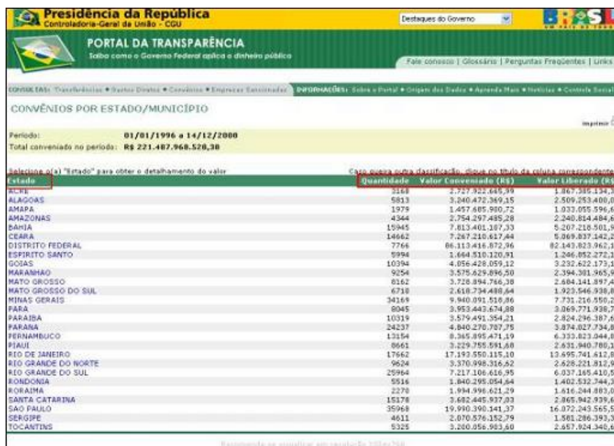
FIGURA V - Convênios por Estado

3) Na tela seguinte são listados todos os Estados que têm algum convênio firmado com o Governo Federal, clique em algum deles para prosseguir com a consulta. Vide Figura V.