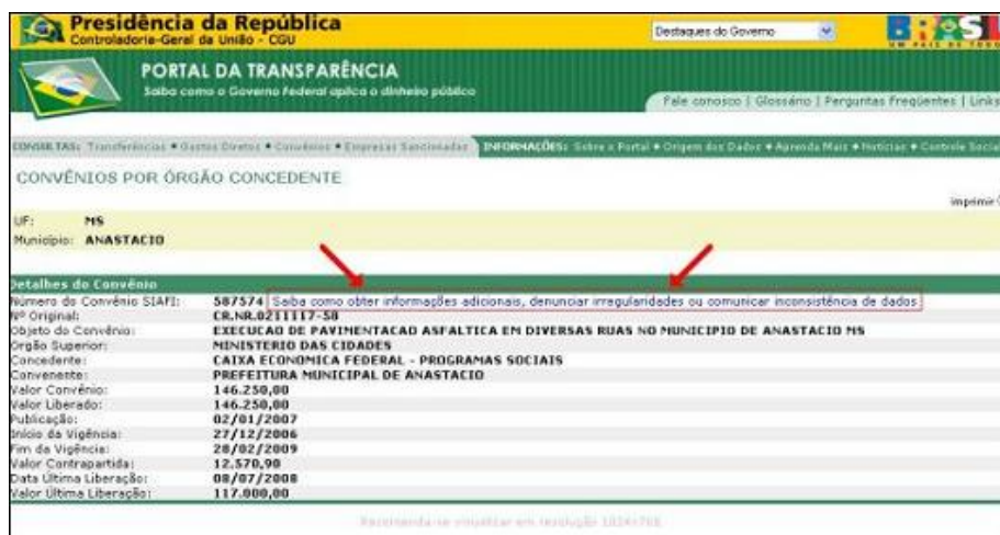
FIGURA XVIII - Detalhamento do Convênio do Municípios selecionado

7) Ao clicar em um número de convênio em azul você terá os detalhes do convênio, inclusive um canal para obter informações adicionais, denunciar irregularidades ou comunicar inconsistência de dados do Portal da Transparência do Governo Federal.