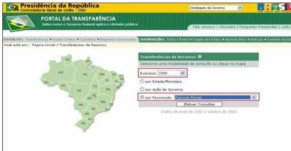
FIGURA XVII TRANSFERÊNCIA POR FAVORECIDOS (Pessoas Físicas)

3) Aparecerá uma lista com o nome e CPF ou NIS de todos os favorecidos pessoas físicas por repasses do Governo Federal, navegue pelas páginas ou escreva no campo ao lado da palavra 'Pesquisar' o nome da pessoa física ou número do CPF ou NIS que deseja encontrar e clique em OK