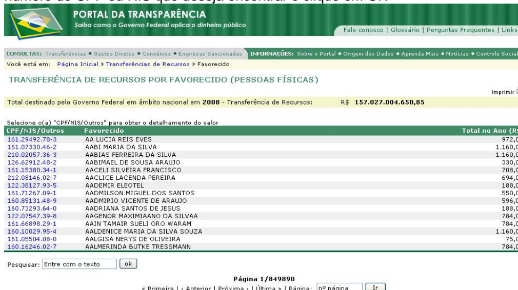
FIGURA XVIII – FAVORECIDOS

3) Aparecerá uma lista com o nome e CPF ou NIS de todos os favorecidos pessoas físicas por repasses do Governo Federal, navegue pelas páginas ou escreva no campo ao lado da palavra 'Pesquisar' o nome da pessoa física ou número do CPF ou NIS que deseja encontrar e clique em OK