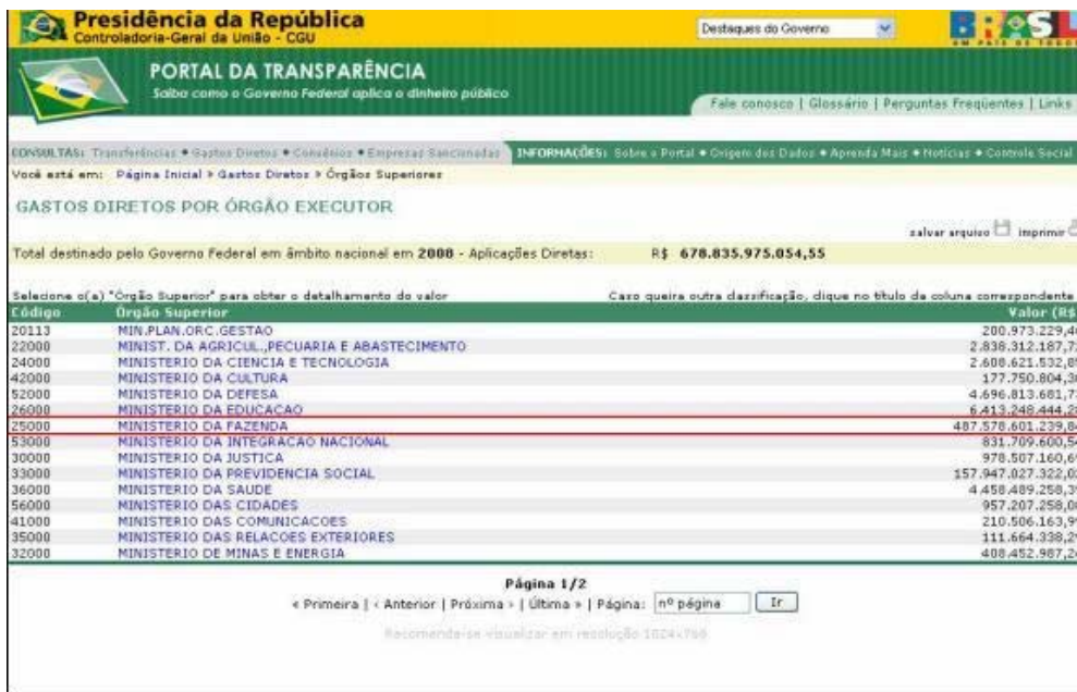
FIGURA XVII – 2 DESPESA POR ÓRGÃO – Órgãos Superiores