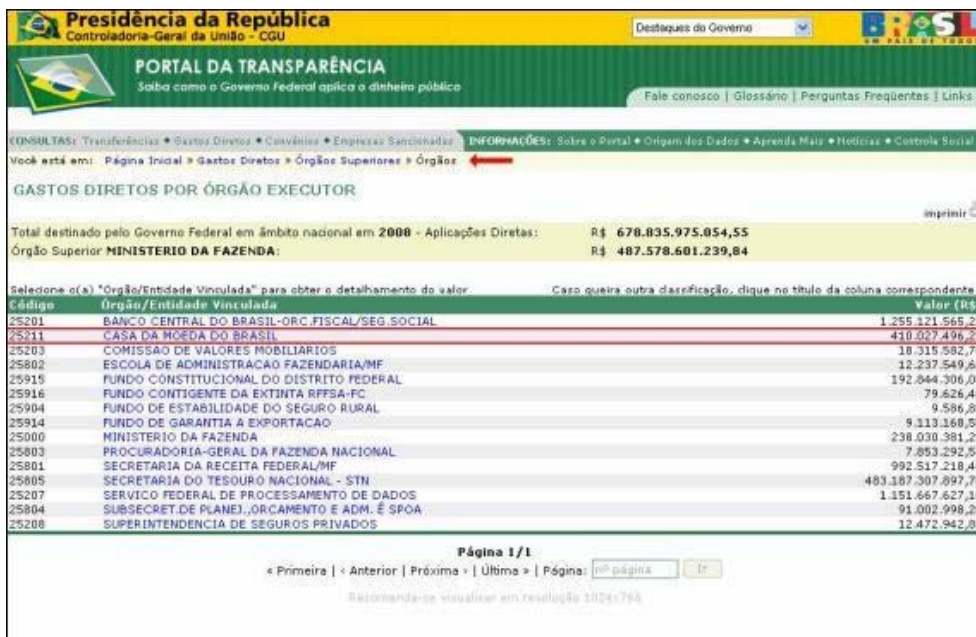
FIGURA XVIII – DESPESA POR ÓRGÃO – Órgãos Superiores - Órgãos