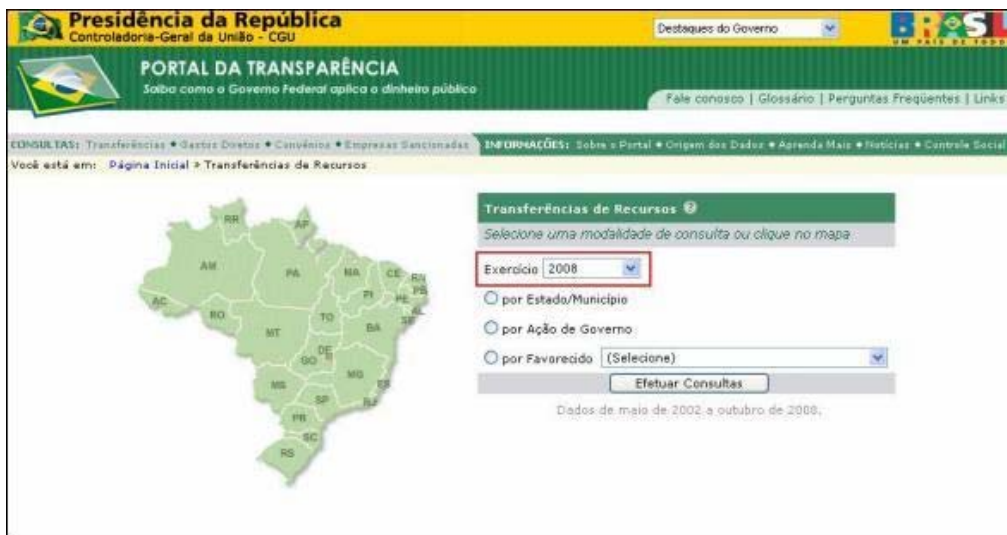
FIGURA III INFORMAÇÕES SOBRE TRANSFERÊNCIAS DE RECURSOS

Nessa tela são apresentadas também opções do ano a ser consultado. Para seguir adiante na consulta basta clicar em alguma das opções e selecionar o ano a ser consultado.