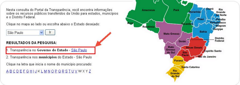
Figura III – Selecionar Estado