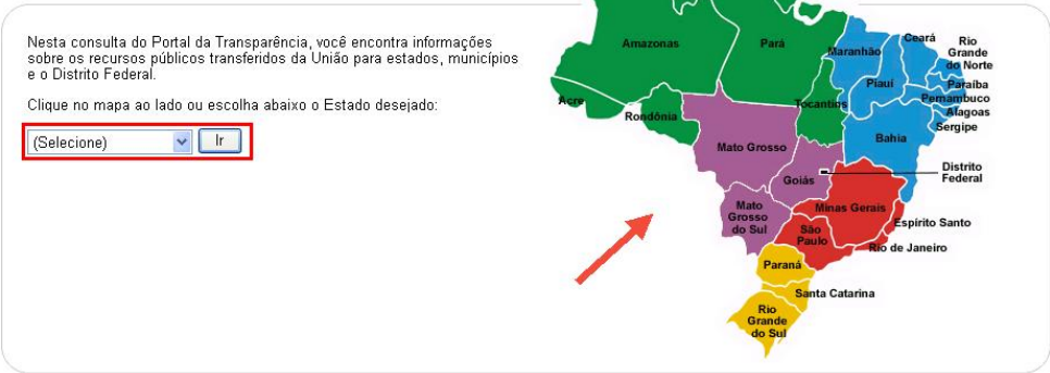
Figura II – Transparência nos Estados